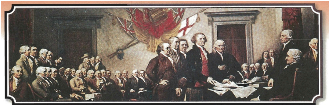
The Declaration of Independence was approved on July 4, 1776.

在 テ 1700 年 ノ 代 ノ 許 ニ 多 ク 美 ノ 國 ノ 人 々 都 モ 希 ム 望 ム 和 シ 英 ノ 國 ノ 分 リ 開 カ 。 那 ノ 時 ノ ， 美 ノ 國 ノ 是 レ 被 ル 英 ノ 國 ノ 統 ヲ 治 ス 的 ナ 。 但 シ 是 レ 許 ニ 多 ク 人 々 都 モ 相 ツ 信 ス 如 シ 果 シ 能 ク 夠 ク 自 ラ 己 ノ 成 リ 立 ク 一 ノ 個 ノ 國 ノ 家 ノ 會 ハ 更 ニ 好 シ 。